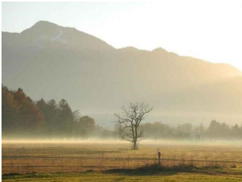
Moos bei Benediktbeuern, Ziel der Exkursion

Exkursion des Fachbereichs „Kirche und Umwelt“