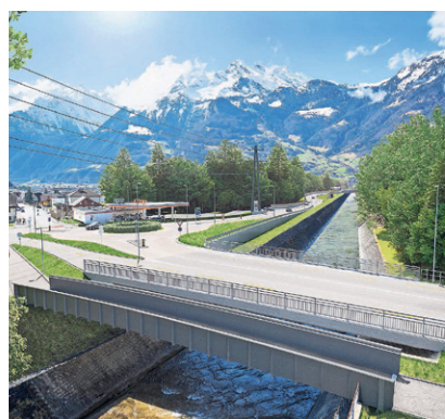
Die Visualisierung zeigt die neue Fussgängerbrücke.

Wysshus Ost und dem Knoten Schächen sowie die Erstellung des neuen A2-Halbanschlusses Altdorf Süd. Neuigkeiten gibt es zudem vom Urner Obergericht, wie die Baudirektion Uri mitteilt: Es hat die Beschwerde eines unterlegenen Unternehmers gegen die Vergabe der Arbeiten an der WOV abgewiesen. (UW) Seite 4