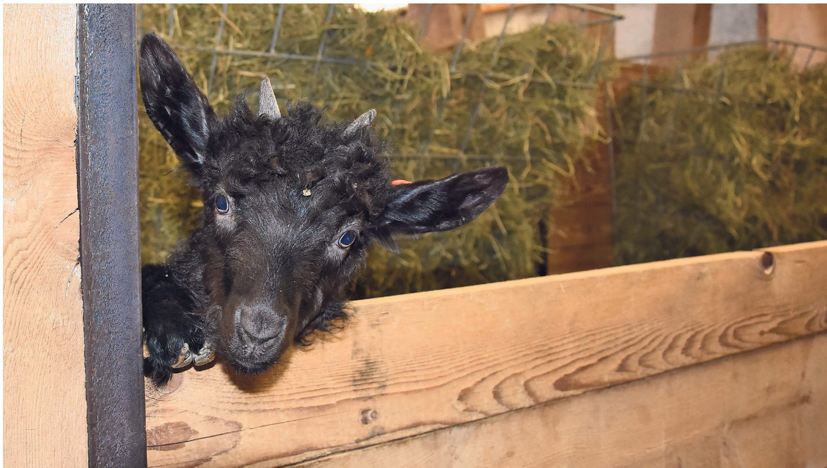
Ein Walliser Schwarzhalsgitzli schaut neugierig über den Boxenrand.