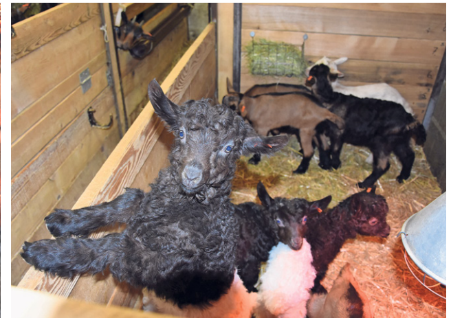
Bei den Gitzi im Geissenparadies in der Göscheneralp geht es rund, wenn Besuch da ist. Im oberen Bild muss eine Gemsfarbige Gebirgsziege schauen, unten rechts eine Walliser Schwarzhalsziege.

«Die Walliser Schwarzhalsgeissen gehören einfach zu mir. Seit ich zehn bin, habe ich diese.»