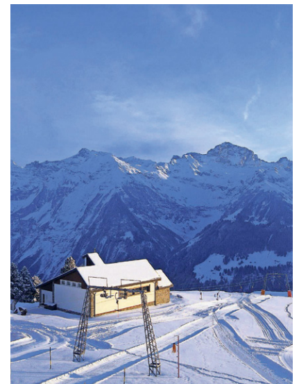
Auch auf dem Biel gab der Schneemangel den Takt vor.

Die Skigebiete im Kanton Uri hatten in der Wintersportsaison 2022/23 mit Schneemangel und ungewöhnlich warmen Temperaturen zu kämpfen. Besonders die kleineren Skigebiete litten darunter, was zu verkürzten Öffnungszeiten führte. Auf dem Biel konnte der Skilift beispielsweise erst am 21. Januar fahren, insgesamt zählte das Skigebiet 22 Skitage. Auf dem eher schattigen Brüsti war die Saison etwas länger, und es reichte für 60 Skitage. Die Skiarena Andermatt-Sedrun ist noch geöffnet und wird bis zum Saisonende am 1. Mai wohl 145 Betriebstage verzeichnen. Für Skitourengeher und -geherinnen gab es hingegen teils gute Bedingungen. (sw) Seite 2