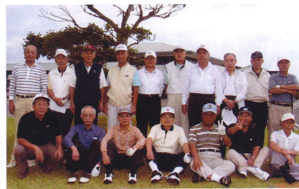
第20回福岡・北九州合同ゴルフ会参加者 於ユーアイゴルフクラブ宗像