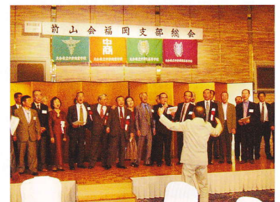
懐かしの校歌を歌う