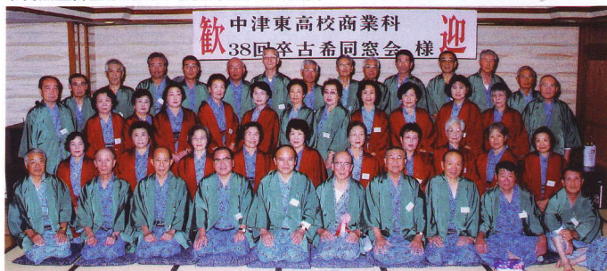
平成19年11月7日 中津東高校商業科38回卒古希同窓会 於 別府清風ホテル