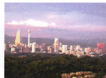
自宅からのクアラルンプール市街の眺め

などを勘案しマレーシアに決め、平成17年5月に生活に必要な物品一式を海送で送り出した上、首都のクアラルンプールに参りました。まずホテルに滞在し、マレーシア・マイ・セカンドホーム・プログラムによるビザの申請手続きを始めると同時に家探しを始め、ホテルを1週間で引き払いコンドミニアム(日本で言うマンション)に移りました。ここは車社会なのですぐ現地生産のプロトンという車を購入しました。荷物も1ヵ月半ほどで到着し徐々にこの街にも慣れて行き、年間を通じて30度程度の暖かいマレーシアでの生活を楽しんでいます。