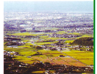
八面山から沖代を望む