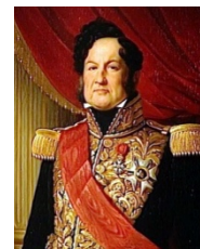
Louis Philippe I er (1773-1850)

Révolutionnaire, patriote et fervent républicain et partisan de l'unité italienne, il combat toute sa vie pour la concrétisation de l'unité italienne et pour l'instauration d'une république. Membre d'une société secrète (les Carbonari) à partir de 1827, il entre dans la clandestinité et la lutte politique. Chef du mouvement « Jeune Italie », il est contraint de s'exiler en France en 1831.