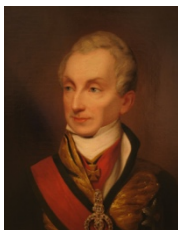
Klemens von Metternich (1773-1859)

Issu de la noblesse allemande, il fait ses études à Strasbourg mais s'oppose à la Révolution puis est contraint de fuir à Vienne. Ambassadeur à Berlin en 1803 puis à Paris en 1806, il devient le Ministre des affaires étrangères autrichien en 1809 et organise le congrès de Vienne à ce titre. Il est nommé Chancelier en 1821 et exerce le pouvoir jusqu'en 1848 où il est chassé du pouvoir lors de la révolte des Viennois.