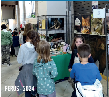
FERUS - 2024

Parce que la photographie animalière et de nature est un formidable outil de sensibilisation, de témoignage, nous laissons une large place à ceux qui protègent la nature.