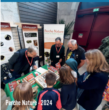
Perche Nature - 2024

4 associations de protection de la nature et de l'environnement ont répondu présentes pour l'édition 2025 : FERUS, la LPO, la Maison de Loire de Loir-et-Cher et Sologne Nature Environnement. Elles sont la voix des défenseurs de la biodiversité au niveau local et national.