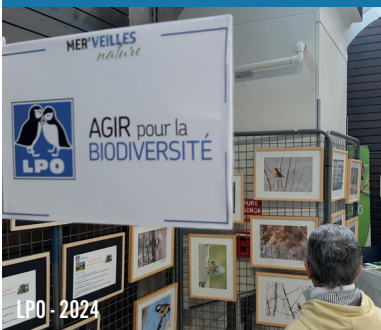
LPO - 2024

Nous accueillerons donc des associations naturalistes locales qui pourront pendant toute la durée du festival, présenter leurs travaux pour le maintien et la protection de la biodiversité.