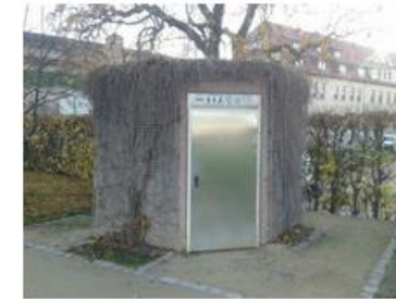
Foto: Öffentliche Toilette: Petersberg Bürgergarten

Beschreibung: einzelnstehende WC-Anlage Standort: nordöstlich des Bürogebäudes Petersberg 19 Öffnungszeiten: 24 Stunden täglich Entgelt: 0,00 EUR Barrierefreiheit: Unisex-Toilette ist behindertengerecht konzipiert, ohne Euro WC-Schlüssel nutzbar