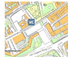
WC Petersberg - Bürgergarten

Beschreibung: einzelnstehende WC-Anlage Standort: nordöstlich des Bürogebäudes Petersberg 19 Öffnungszeiten: 24 Stunden täglich Entgelt: 0,00 EUR Barrierefreiheit: Unisex-Toilette ist behindertengerecht konzipiert, ohne Euro WC-Schlüssel nutzbar