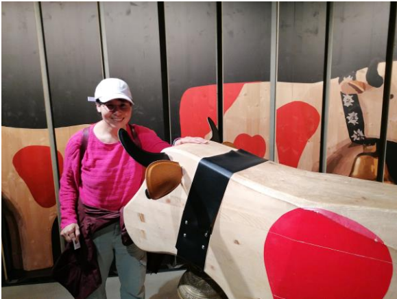
Trauffer Museum Hoffstetten