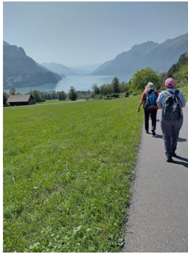
Wandern zum Brienersee,