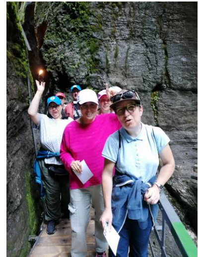
In der Aareschlucht

Am Morgen des vierten Tages malten wir im Garten Einkaufsstofftaschen. Auch hier hatten die Gäste viele tolle Ideen. Nach einem kleinen Mittagessen fuhren wir mit der Bahn zur Mägisalp und wanderten danach zum Bidmi runter. Die Aussicht auf die Gletscher und die Engelshörner war wunderschön. Am Abend grillierten wir im Garten, dazu gab es einen feinen Risotto und verschiedene Salate. Zum Tagesausklang sangen wir in der Stube viele Wanderlieder und sogar einige italienische Lieder für und mit Silvana.