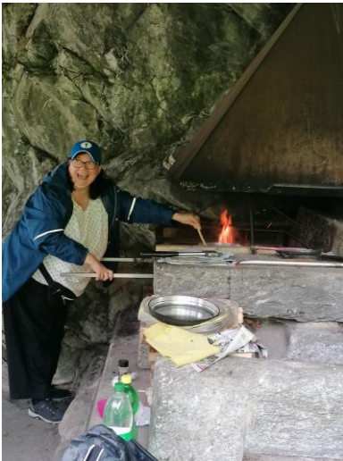
Maggry auf dem Feuer kochen,

fuhren auf den Turren, wo wir im dichten Nebel gemütlich Kaffee tranken. Wieder zu Hause backten wir Fleischkäse und Gemüse im Ofen. Dazu gab es eine feine Kräuterquarksauce. Den Abend rundeten wir mit einem spannenden Lotto ab.