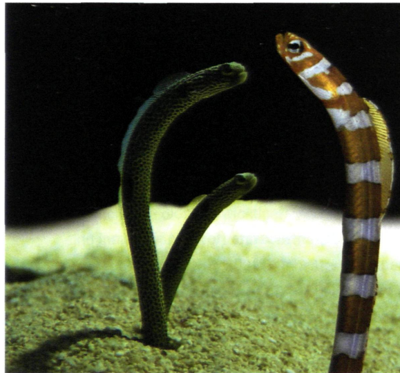
Heteroconger hassi (links) und Gorgasia preclara (rechts)

Röhrenaale (Unterfamilie Heterocongrinae) sind hochspezialisierte Fische, die weltweit in tropischen Meeren auf Sandgrund vom Flachwasser bis in 50 m Tiefe leben. Die Kolonien können bis zu 5000 Individuen erreichen (CLARK 1980 und CLARK et al 1990). Röhrenaale bauen sich im Sand senkrechte Röhren, die mit kurzen Stoßbewegungen mit dem spitzen, harten Schwanzende gegraben werden (FRICKE 1970). Hautdrüsen produzieren ein Sekret, mit dem die Wohnröhre verfestigt wird (CASIMIR et al. 1971). Bei Gefahr ziehen sie sich blitzschnell in die Röhre zurück. Als Planktonfresser sind Röhrenaale auf eine ständige Strömung angewiesen. Aus dieser schnappen sie sich mit wiegenden Bewegungen tierische Kleinstlebewesen.