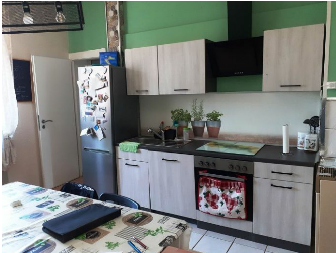
Küche Bild 1