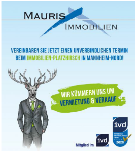
Facebook_Aquise KaufVermietung_Mauris Immobilien P