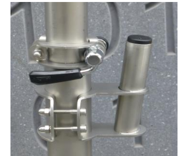
Vorrichtung zur Aufnahme eines Sattel-Stützen-Gepäckträgers