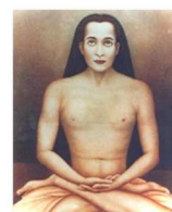
Kriya Babaji Nagaraj