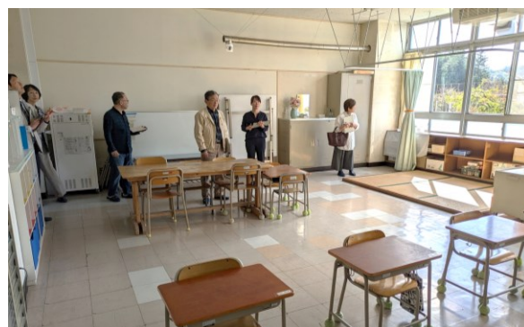
なかよし教室の確認