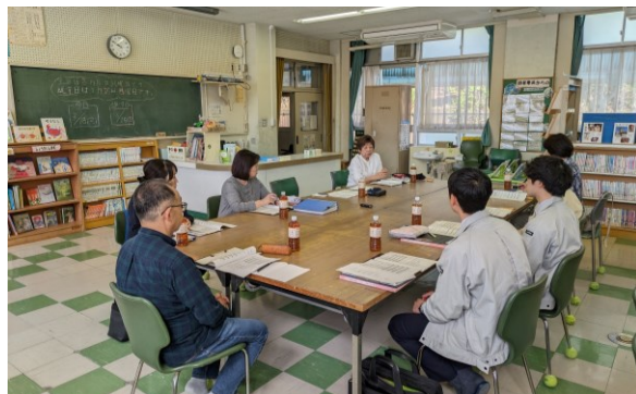
検討委員会の審議状況