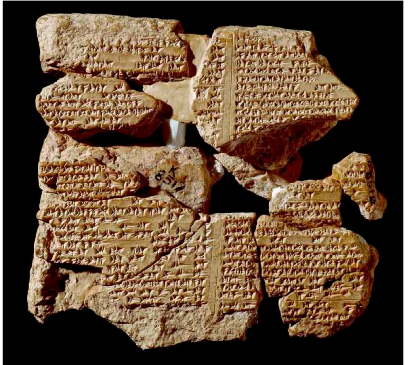
Tablette du XIIIème siècle av. J.-C. Le rêve de Gilgamesh. A été retrouvée en Turquie. La face antérieure relate deux des songes inquiétants qui annoncent à Gilgamesh les dangers que lui réserve la forêt des cèdres. Sur la face postérieure, on trouve l'épisode du combat contre le taureau céleste. British Museum, Londres.

La laïcité est un principe fondamental dans notre pays. Il permet à chacun de choisir librement sa religion, et de la pratiquer dans le respect des autres. Il protège aussi contre la discrimination. Le respect de la laïcité permet à tout le monde de vivre ensemble et en paix.