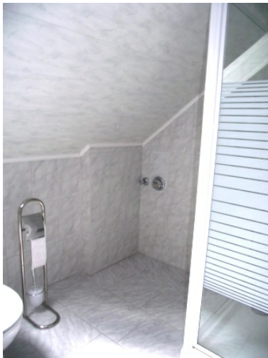
Tageslichtbad Bild 2