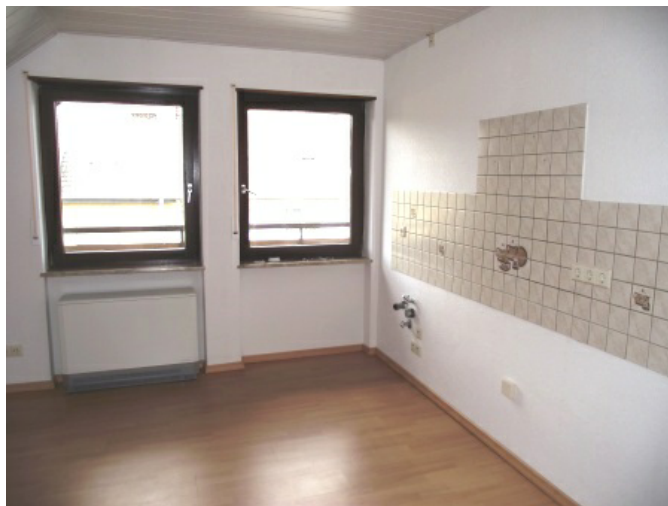
Wohnküche Bild 1