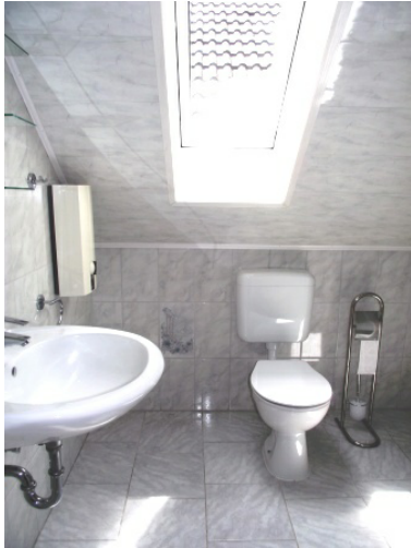
Tageslichtbad Bild 1