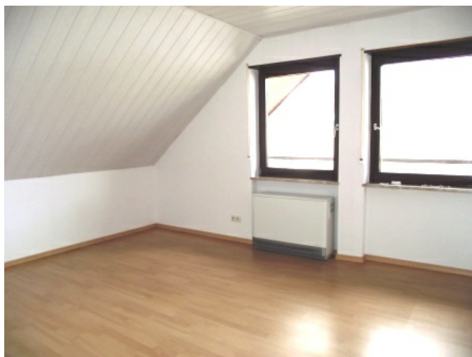
Wohnküche Bild 2