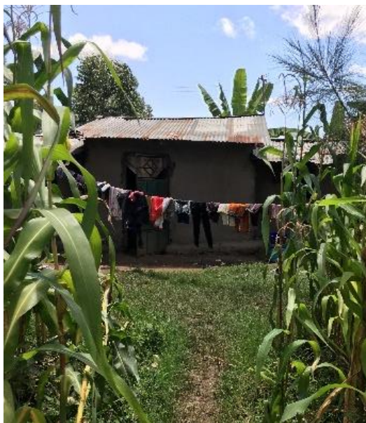
Grace ihre Hütte