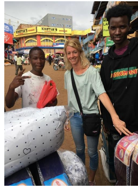
Neue Matratzen für die Jungs