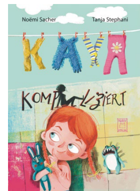
2021 erschienen: Kaya Kompliziert