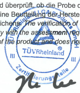
Tongle Lee Zertifizierungsstelle

Die Konformitätsprüfung bezieht sich auf das oben genannte Produkt. Hiermit wird überprüft, ob die Probe den oben genannten Bewertungsanforderungen entspricht. Diese Überprüfung impliziert keine Beurteilung der Herstellung des Produkts und erlaubt nicht die Verwendung eines TÜV-Rheinland-Konformitätszeichens. The verification of conformity refers to the above mentioned product. This is to verify that the specimen is in conformity with the assessment requirement mentioned above. This verification does not imply assessment of the production of the product and does not permit the use of a TÜV Rheinland mark of conformity.