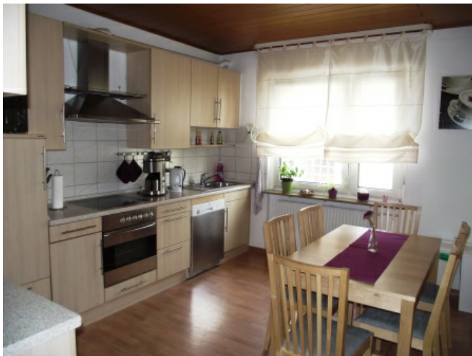
Wohnküche Bild 1