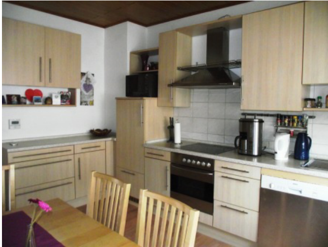
Wohnküche Bild 2