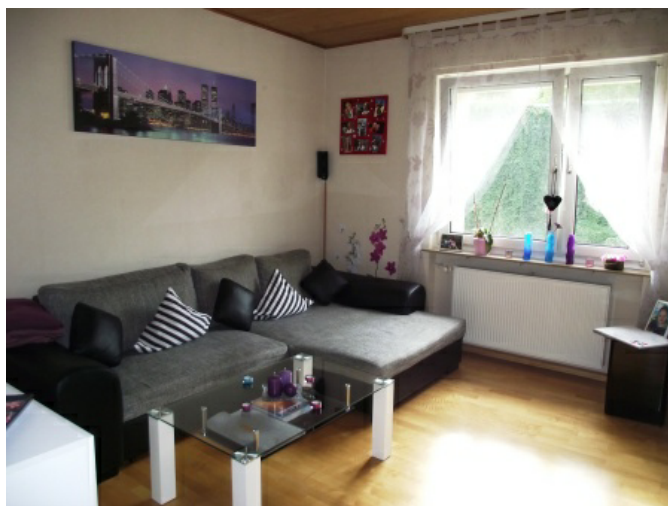
Wohnen Bild 1