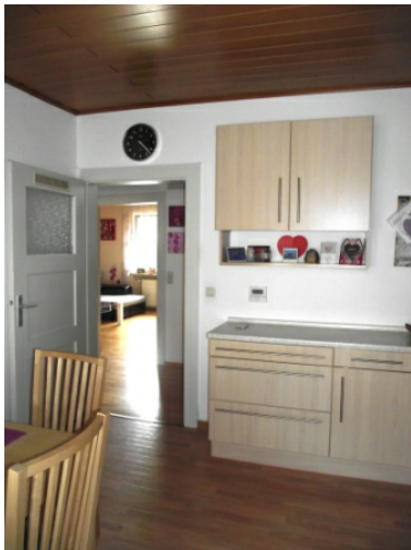
Wohnküche Bild 3