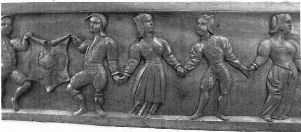
Fig. 12 : Bas relief hôtel Senecé