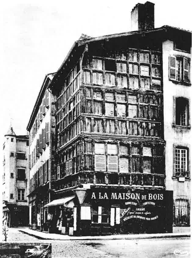
Fig. 13 : Maison de Bois