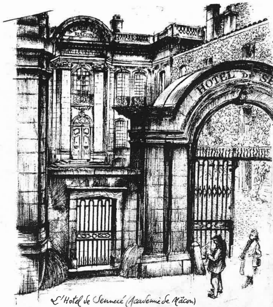
Fig. 11 : Hôtel Senecé – Siège de l'Académie (auteur inconnu)