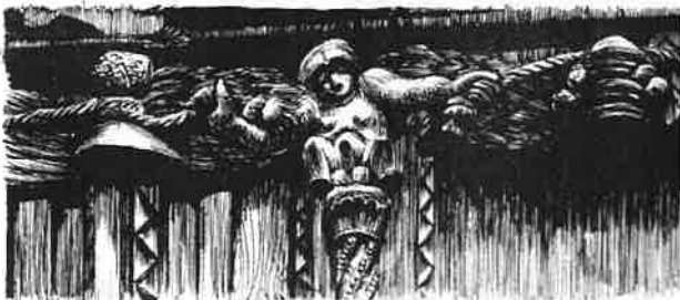
Fig. 14 : Bas reliefs Maison de Bois (dessin de Daniel Chantereau dans "Visages de Mâcon", 1955)