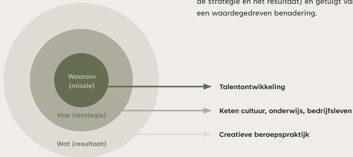
Figuur 4: Visievorming (de drie elementen)