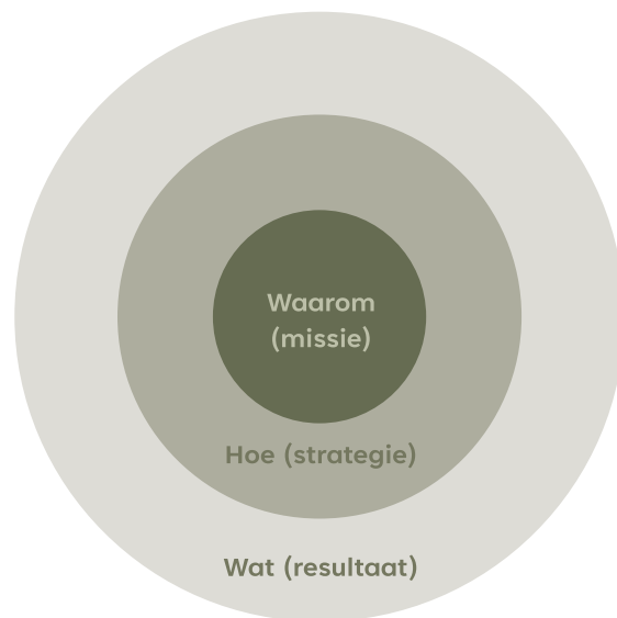
Figuur 2: Visievorming (een succesvolle benadering)

De ontwikkeling van broedplaatsen in Breda verloopt probleemgestuurd. De dagelijkse praktijk laat een tekort aan werkruimten zien, de tijdelijkheid van de locaties wordt ervaren als problematisch, zo ook de lage kapitaalcracht van gebruikers, de hoge huurcompensatie die de gemeente moet bieden en soms de onwil van gebruikers om hier iets tegenover te stellen. Deze knelpunten maken het voor broedplaatsen in de stad lastig om hun missie te volbrengen.