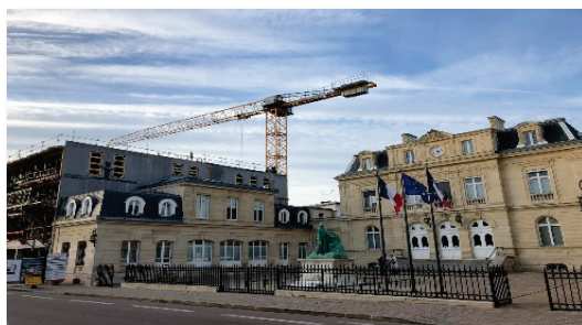
Les dommages créés par les PLU successifs de 2010 et 2015 sont réels

Contrairement à ce qui est véhiculé, nous ne sommes pas contraints de « bétonner » autant notre ville