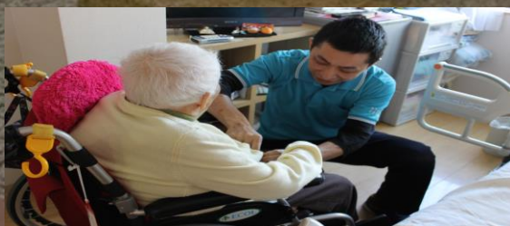
『ケアセンターすずらんの花』