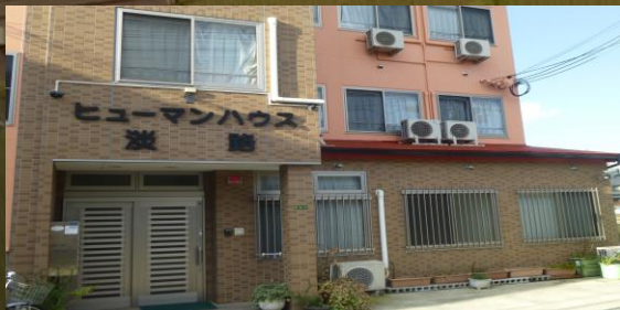
『ヒューマンハウス淡路』