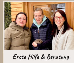
Erste Hilfe & Beratung