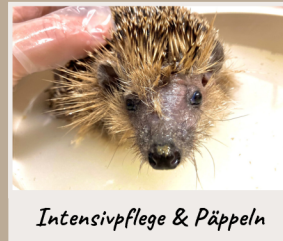
Intensivpflege & Päppeln