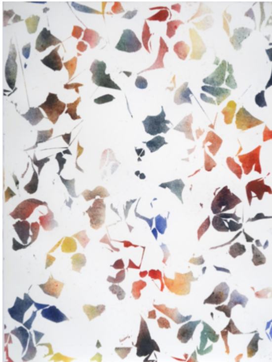
Papiers écorchés n°389 acrylique sur papier 89,7x115 cm 2021