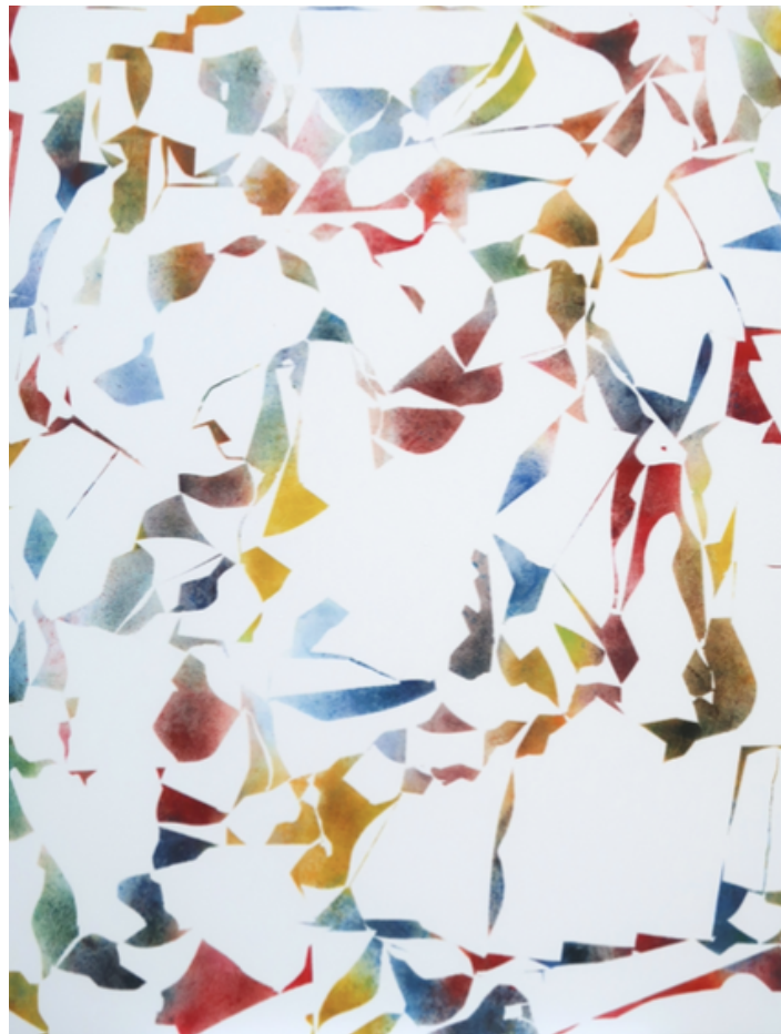
Papiers écorchés n°395 acrylique sur papier 80 x100 cm 2022