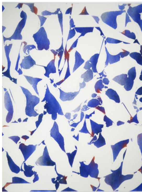
Papiers écorchés n°335 acrylique sur papier 89,7x115 cm 2021