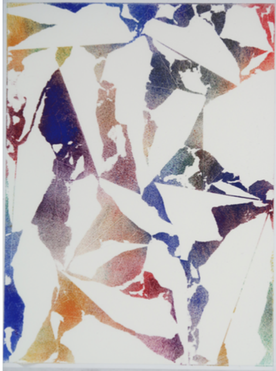
Papiers écorchés n°296 acrylique sur papier 30x40cm 2021