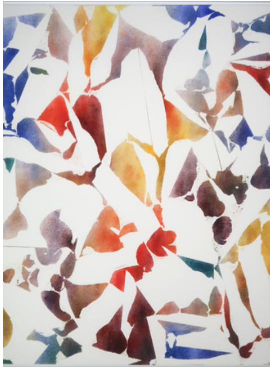
Papiers écorchés n°336 acrylique sur papier 100 x119,7 cm 2021