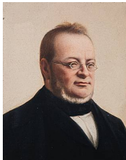
Camillo Cavour (1810-1861)

Issu de la noblesse, il milite pour faire de la Sardaigne une monarchie constitutionnelle. Premier ministre du roi de Sardaigne de 1852 à 1861, il se rallie à l'idée d'une unité italienne autour du Piémont. Il passe un accord secret avec la France permettant à Victor Emmanuel II d'être proclamé roi d'Italie.