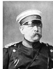
Otto von Bismarck (1815-1898)

Fils du roi Charles-Albert de Sardaigne, il devient roi de Sardaigne à partir de 1849 et fait de Cavour son Premier ministre à partir de 1852. Grâce à un accord secret entre Cavour et Napoléon III, Victor Emmanuel II devient « roi d'Italie » en 1861. Il soutient l'unité italienne et fait de Rome sa capitale.