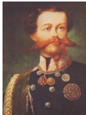
Victor Emmanuel II (1820-1878)

Issu de la noblesse, il milite pour faire de la Sardaigne une monarchie constitutionnelle. Premier ministre du roi de Sardaigne de 1852 à 1861, il se rallie à l'idée d'une unité italienne autour du Piémont. Il passe un accord secret avec la France permettant à Victor Emmanuel II d'être proclamé roi d'Italie.