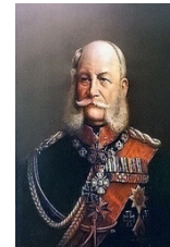
Guillaume I er (1797-1888)

Issu de la noblesse, il est élu député en 1847 et soutient la répression de 1848-1849. Il est nommé chef du gouvernement prussien par Guillaume I er en 1861. Grâce à ses victoires, il est l'artisan de l'unité allemande. Il est chancelier du Reich jusqu'à son renvoi en 1890 par l'Empereur Guillaume II.