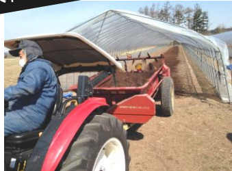
職人技で堆肥散布中