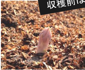
4月2日 顔を出したアスパラ