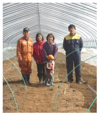
今年も美味しいアスパラ作り、頑張ります！