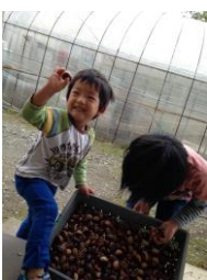
栗 作を 飯を はごし 豊能 は栗 去年 で栗 堪能 た♪