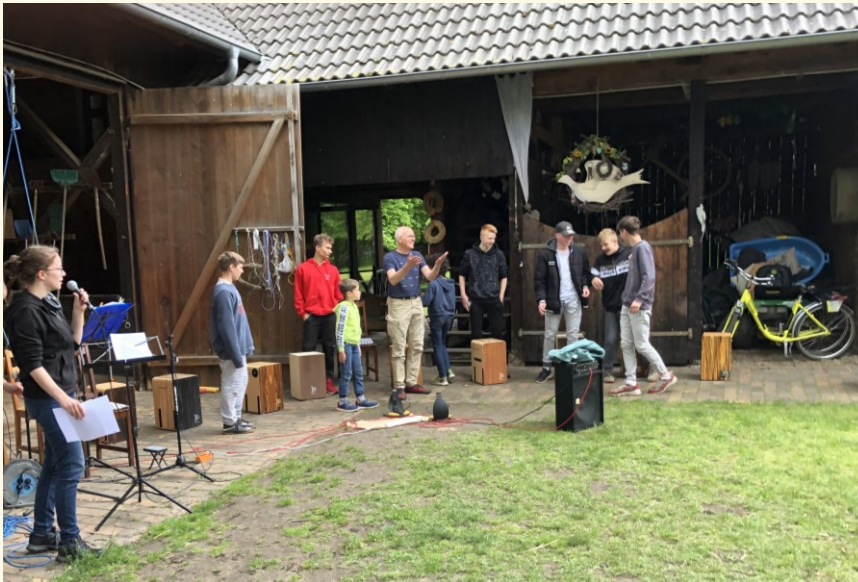
... kurz vor dem Auftritt ...

Die gesamte Organisation funktionierte reibungslos. Durch die perfekte und eingespielte Organisation im Kinder- und Jugendhaus war für ein grundlegendes und leckeres Essensangebot gesorgt, das durch Beigaben aller beteiligten Menschen vervollständigt wurde. Alle behördlichen Vorgaben wurden eingehalten - hier hatten wir wegen einer