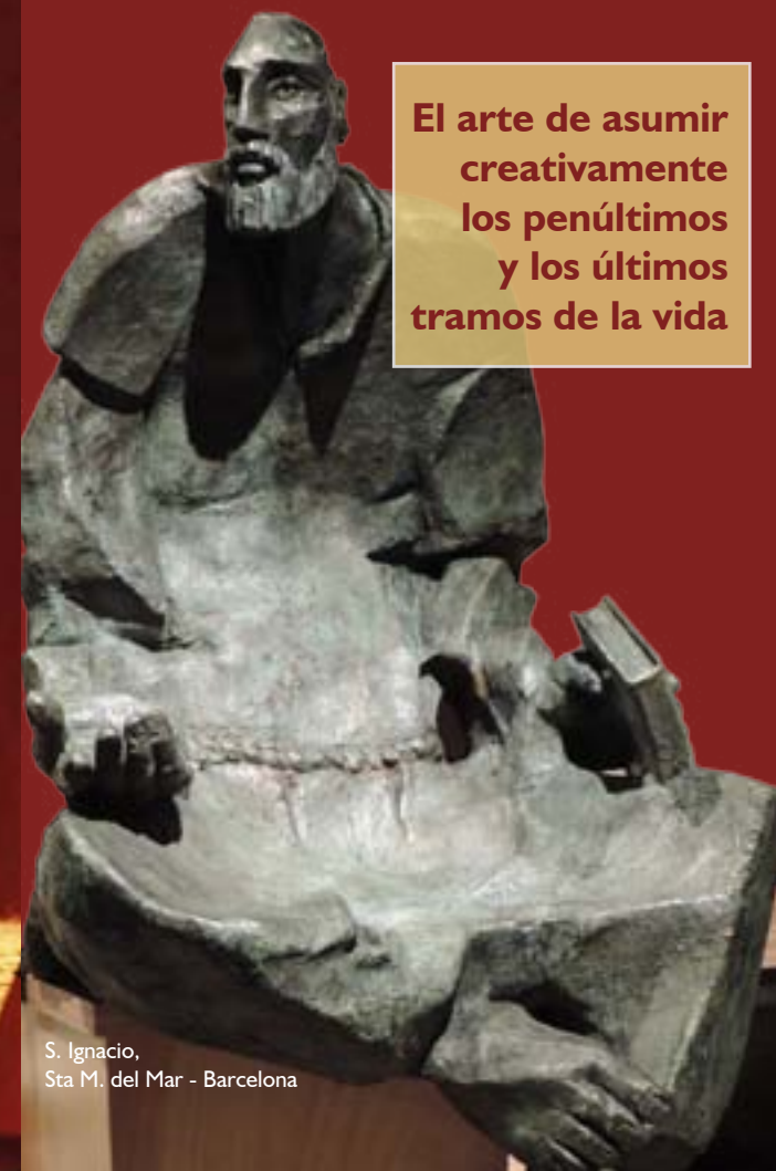
S. Ignacio, Sta M. del Mar - Barcelona

El arte de asumir creativamente los penúltimos y los últimos tramos de la vida