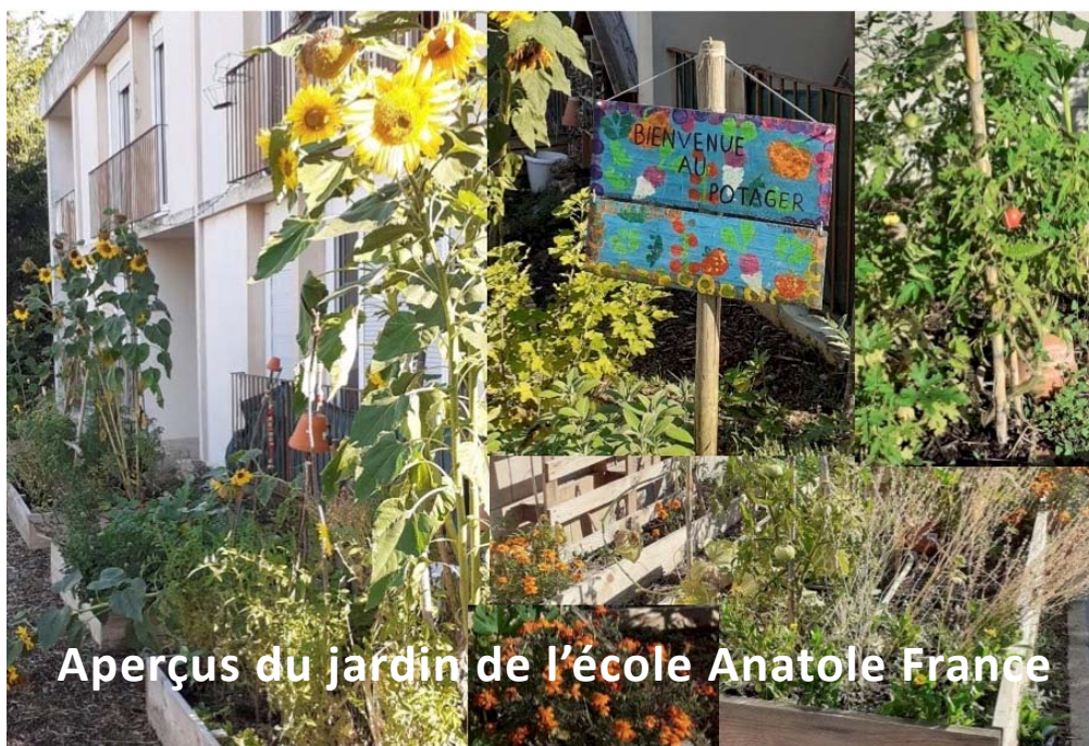
Aperçus du jardin de l'école Anatole France

Le premier mercredi du mois de 10h à 12h Salle 2B au CSC 4 boulevard des Pyrénées (si accès autorisé au public)