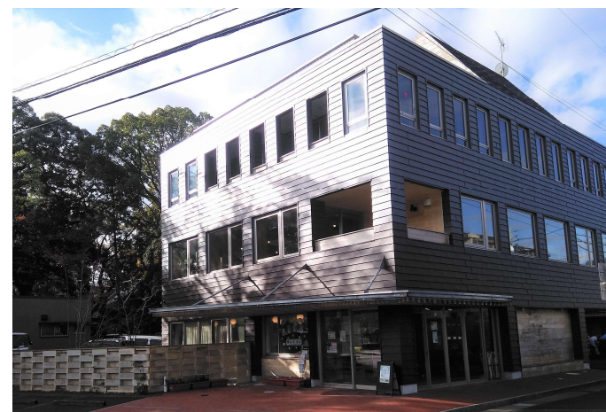
いちぼし堂の外観 弊社は、いちぼし堂の2階にオフィスがあります。