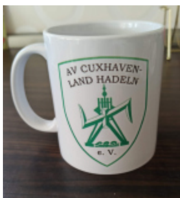
Großer Kaffeebecher, weiß mit grünen Vereinslogo 7,50 €

Daneben besteht die Möglichkeit, sowohl Kaffeebecher als auch Qualitätsmützen mit unseren Vereinswappen zum Selbstkostenpreis zu erwerben: