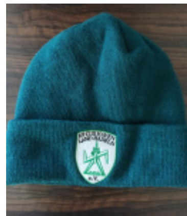
Regatta Mütze mit Thinsulate-Futter, dunkelgrün mit Vereinslogo 15,00 €

Die Artikel können auch während der Bürozeiten, dienstags von 17 bis 18 Uhr, im Vereinsheim Wohlsenstraße 30 in Franzenburg erworben werden.