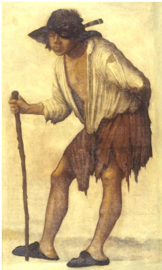
Fig. 7. Jacques Bellange. Mendigo mirando a través del sombrero . Baltimore. Walters Art Museum

Con todo lo expuesto no resulta difícil suponer que la obra habría sido retirada de la Quinta al poco de haberla cedido Goya a su nieto Marinito; y es muy probable que hubiese sido el mismo Goya —por lógico interés propio— el que la pudo haber conducido a Francia, donde debió haber sido pasada a lienzo para facilitar su traslado y mantenimiento. Eso explicaría su actual estado de conservación y características técnicas. Lo que debió de haber sucedido en un tiempo en el que, el propio Javier, parece que se avergonzaba de la existencia de la decoración de la Quinta, habiéndolo tapado las pinturas con cortinajes mediante «colgaduras de percal». Así