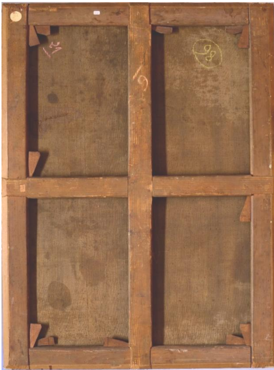
Fig. 4. Mendigo ciego . Dorso actual de la obra

De su hombro derecho cuelga un gran bolso del que sobresale la parte superior de una marmita redondeada o plato sopero para comer, que parece querer sujetar por la correa, apretando la misma con su encabestrado miembro, cuyo vendado extremo pone de manifiesto la posesión de alguna enfermedad que afectaría al menos a la mano, más allá de cualquier afección en el brazo que hubiese justificado la necesidad de inmovilizarlo. Por lo demás, protege su cabeza con un andrajoso sombrero con apariencia de murciélago, con las alas desplegadas, aunque agachadas, con el cual parece querer preservar su dificultoso y jorobado caminar de un sol abrasante, que vendría denotado por la amarillenta atmósfera que lo envuelve 15 .