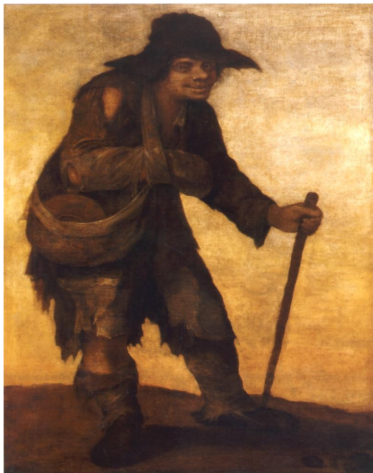
Fig. 3. Mendigo ciego . París. Colección privada

Representa a un hombre de cierta edad, vestido como un andrajoso que, con la mirada perdida y con una leve sonrisa en su rostro, camina hacia la derecha (en la dirección Este del espectador) ayudándose con un bastón, el cual maneja con su mano izquierda 14 . Por el contrario, la mano derecha la presenta vendada y sujeta en cabestrillo. Nada más hay de significativo en la escena, salvo la presencia por la parte inferior derecha de un conjunto de tres o cuatro objetos que parecen piedras y que, si valoramos en relación a la figura del can, podrían entenderse, dado lo difícil que resulta reconocerlas, como posibles deyecciones del animal (Fig. 3).