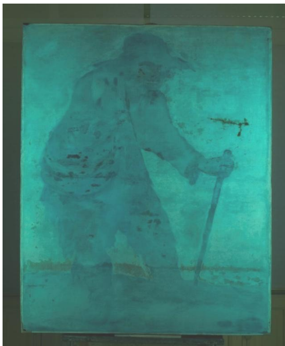
Fig. 5. Mendigo ciego . Vista del soporte con rayos ultravioleta

A diferencia de las obras expuestas en la galería alta del museo, que todas presentan bastidores españoles, ésta lleva un bastidor de «tipo belga», con dobles cuñas en las esquinas, que le debió ser colocado en Francia cuando fue montada sobre tela de lino. Y como parte del proceso de dicho traspaso sobre el mencionado lienzo, por el reverso de la obra original se aplicó un relleno nivelador de color ocre tostado, compuesto principalmente de yeso, tierra roja, tierra ocre y trazas de negro de carbón. Sin embargo, esta capa no se ha detectado en las muestras de las obras del Prado y puede indicar que el traspaso a lienzo se realizó en Francia (Fig. 5).