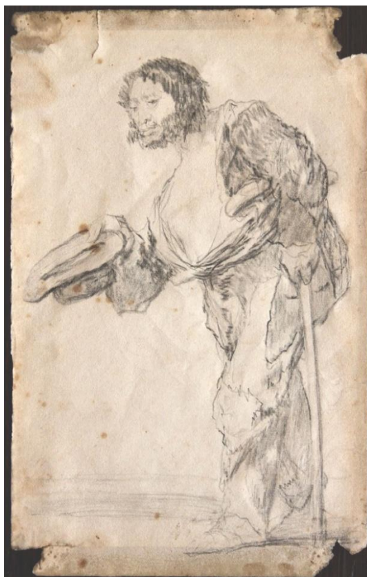
Fig. 6. Atribuido a Goya. Mendigo . Madrid. Colección privada

No vamos a insistir ya más, aquí, sobre lo propenso que fue Goya a dibujar mendigos, especialmente entre 1820 y el final de su vida, ocho años después. Alguno incluso muy cercano al que el cuadro muestra, como por ejemplo uno que se le atribuye en una colección privada española (Fig. 6).