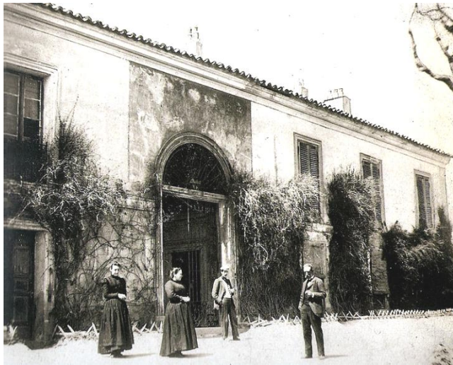
Fig. 1. Vista exterior de la Quinta del Sordo. Única foto conservada

Una de estas nuevas aportaciones sería la más que probable existencia de unas pinturas murales, anteriores al trabajo que realizara sobre sus paramentos, bastante tiempo después, el último actuante, que lo hizo al óleo mezclado con «aglutinante proteico». O lo que es lo mismo, antes de que el Barón Emile D'Erlanger las arrancara de su sitio para llevar a cabo una supuesta operación de salvamento, cuya vertiente crematística hasta descansar entre los fondos de nuestra primera pinacoteca, todavía no ha sido suficientemente explicada. Por más que, a muchos, la versión oficial tradicional, basada en la generosa dádiva, les siga pareciendo convincente. Lo que sí parece estar claro es que el último interviniente en sus paramentos no realizó las pinturas con la técnica del fresco, sino aplicando directamente óleo puro sobre la superficie mural; técnica ésta que Francisco de Goya conocía perfectamente, porque la había aprendido durante su estancia en Italia de los pintores romanos del siglo XVIII 3 .