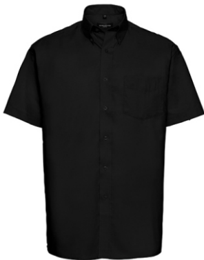
black Print: white