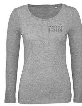
sport grey (heather)