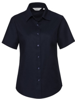
black Print: white