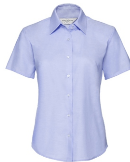
oxford blue Print: white