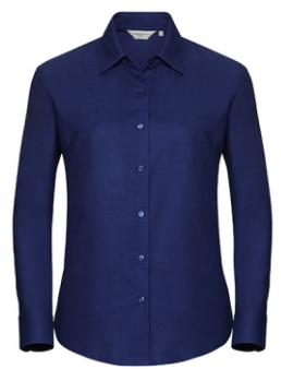
royal blue Print: white