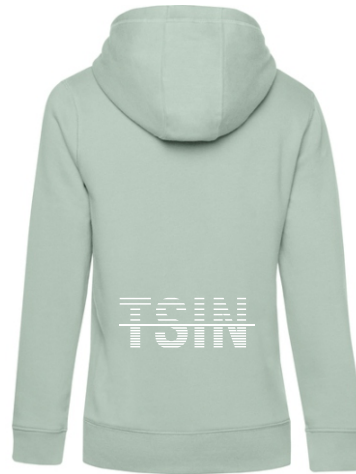
Farbe: aqua green

MEINE BESTELLNUMMER WW02Q DU KANNST MICH BESTELLEN IN XS - 3XL ICH KOSTE, EGAL WELCHES DESIGN 53,00 €