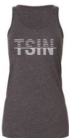
dark grey (heather)