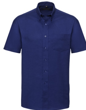
royal blue Print: white