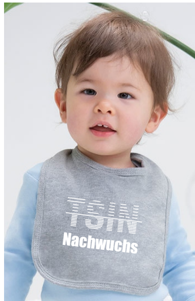
Farbe: heather grey, Stick: white