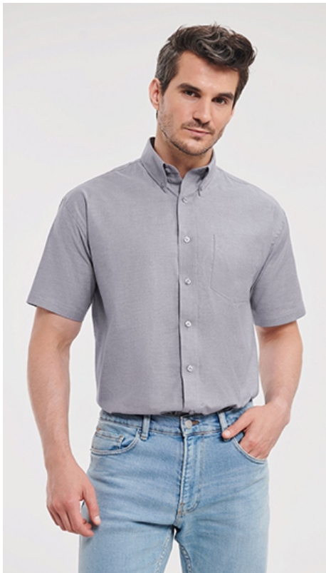
Farbe: silver, Print: white

Ich bekomme ein dezentes Logo auf die linke Kragenseite.