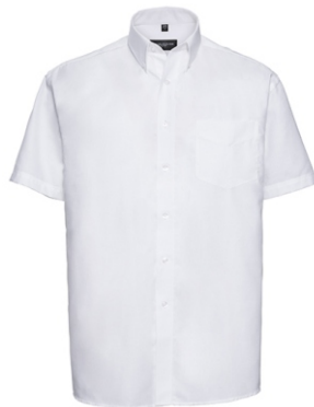
white Print: grey