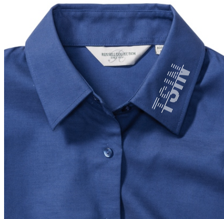
Farbe: royal blue, Print: white