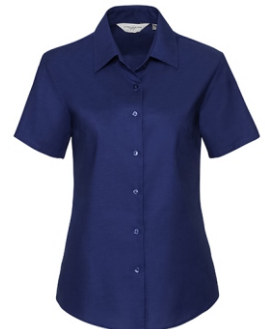
royal blue Print: white