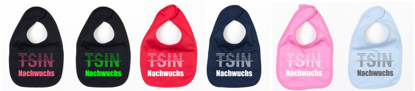
black Stick: neon pink

Ich bin ein praktisches Baby Lätzchen und bekomme ein Logo und ein Schlagwort oder Namen aufgestickt.