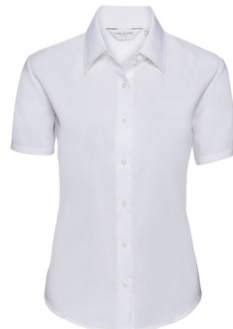
white Print: grey