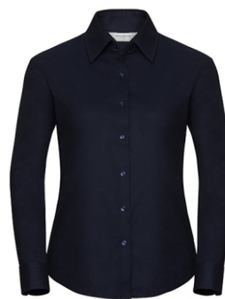
navy blue Print: white