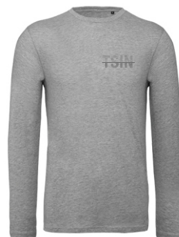
sport grey (heather)