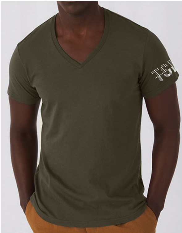
Farbe: Khaki green

Ich bekomme ein Schullogo auf den Ärmel.