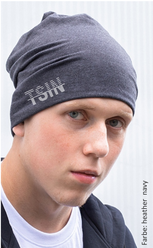
Farbe: heather navy