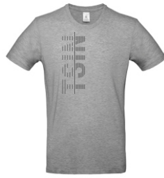
sport grey (heather)