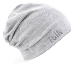
heather light grey