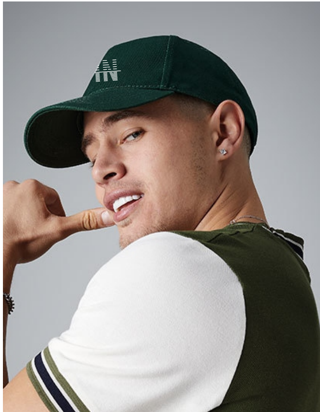
Farbe: bottle green, Stick: white

Ich bin ein 5-Panel Cap und werde mit einem Stick veredelt.