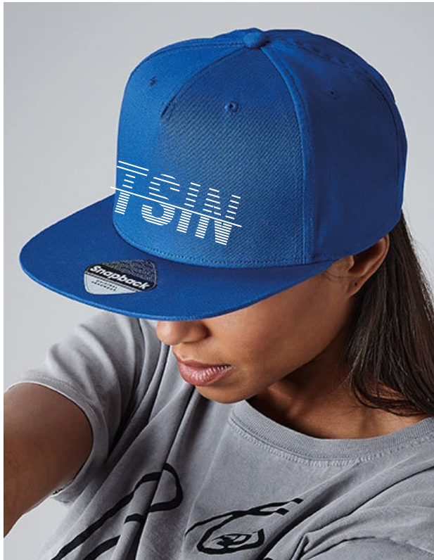
Farbe: bright royal, Stick: white

Ich bin ein 5-Panel Snapback Rapper Cap und werde mit einem Stick veredelt.