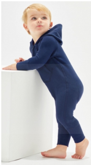
Farbe: nautical navy