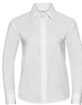
white Print: grey