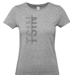
sport grey (heather)