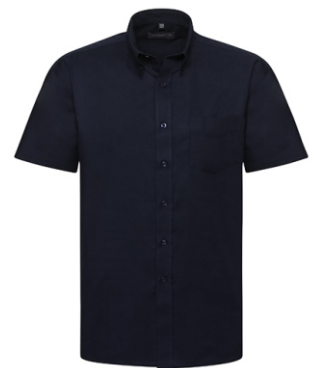
navy blue Print: white