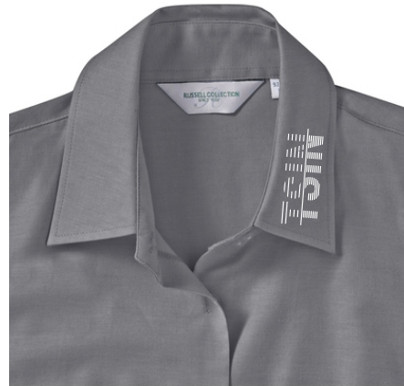
Farbe: silver, Print: white