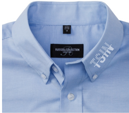
Farbe: oxford blue, Print: white