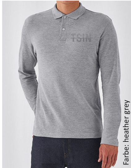
Farbe: heather grey