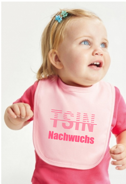
Farbe: light pink, Stick: pink