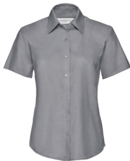
silver Print: white