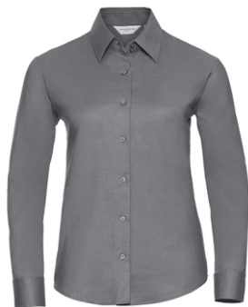
silver Print: white