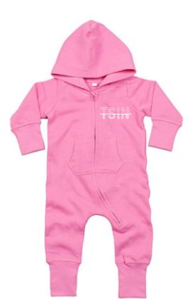
bubble gum pink