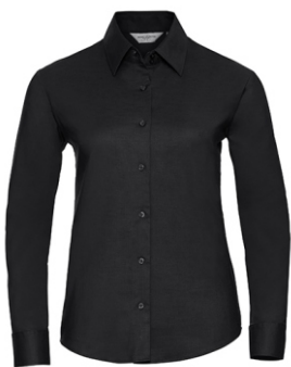
black Print: white