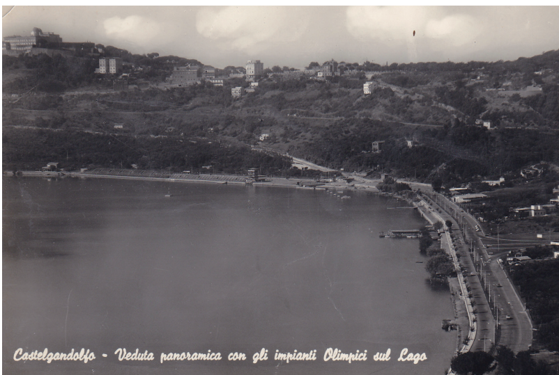
Castelgandolfo - Veduta panoramica con gli impianti Olimpici sul Lago

Però, non è da indietreggiare troppo nel tempo per trovare meno fracasso di ora. Ricordo che una sessantina o poco più di anni fa, quando il lago arrivava a quella che dal 1960 è divenuta – in occasioni delle Olimpiadi – un'asfaltata, e le spiagge enormi di oggi erano sepolte a una decina di metri di profondità, sentivi il chiacchierio dei bagnanti stipati nel poco spazio lasciato dalle acque, il suono piacevole dei tuffi. Finché non sono venute le barche a motore contro le quali ci battemmo in molti, e vincemmo, final-