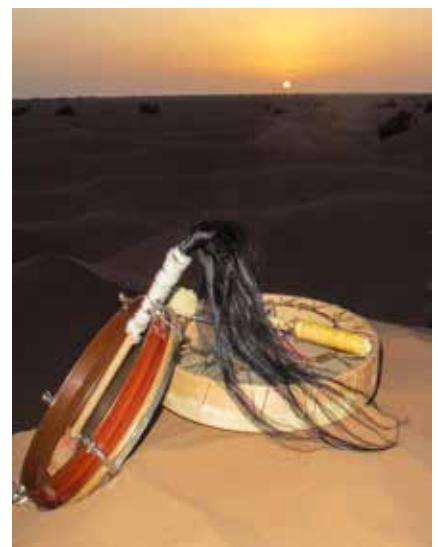
Bei Sonnenuntergang wird musiziert