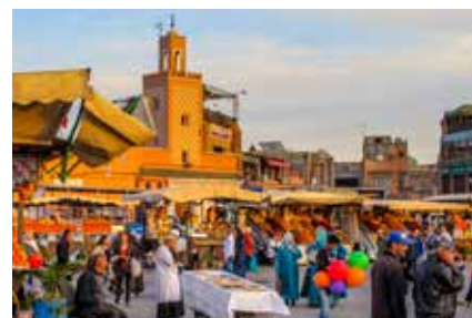
Marktstände mit frischen Speisen in Marrakesch