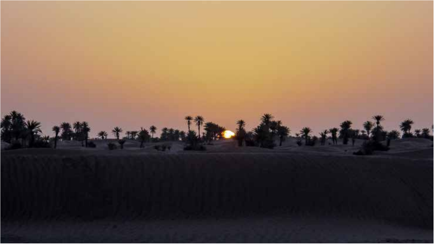
Sonnenuntergangsstimmung in der marokkanischen Wüste