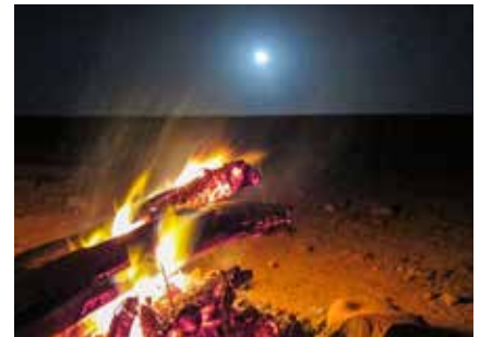
Lagerfeuer bei Vollmond

Bitte beachten Sie, dass am Abend die Temperaturen merklich sinken und eine Fleece-Jacke durchaus benötigt wird.