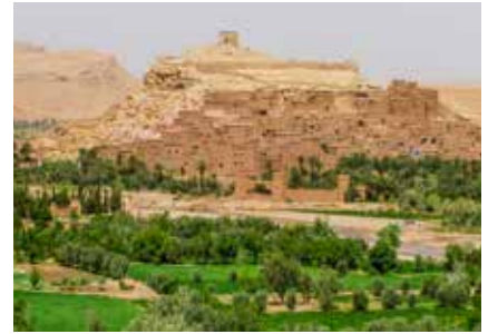
Die Draa Oase