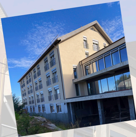
Vue actuelle de la maison de retraite en construction

Nous construisons une maison de retraite en Moldavie afin d'offrir une meilleure qualité de vie aux personnes âgées.