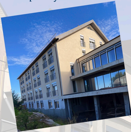
Current view of the retirement home under construction

We are building a retirement home in Moldova to offer senior citizens a better quality of life.