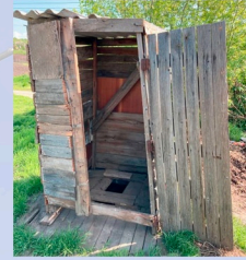
Les toilettes actuelles (latrines) de nombreux retraités

Beaucoup des personnes âgées que nous avons rencontrées ne savent même pas où leurs enfants travaillent actuellement ni comment ils vont. C'est pour ces personnes que nous construisons une nouvelle maison de retraite à Cahul.