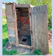
Momentanes Plumpsklo vieler Senioren

Viele der älteren Menschen, die wir kennengelernt haben, wissen nicht einmal wo ihre Kinder jetzt arbeiten. Für diese Menschen bauen wir in Cahul ein neues Altersheim.