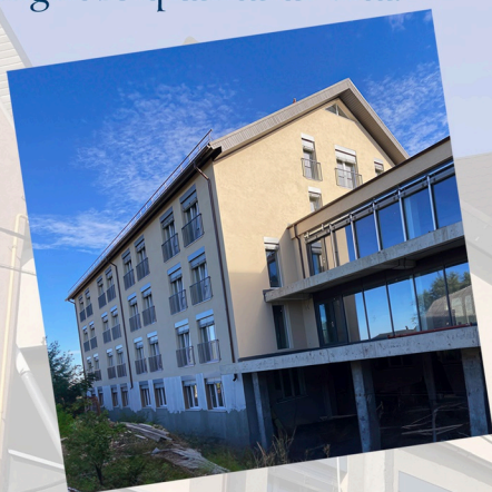
Vista attuale della casa di riposo in costruzione

Stiamo costruendo una casa di riposo in Moldavia per offrire agli anziani una migliore qualità di vita.