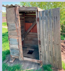
L'attuale latrina di molti anziani

Molti degli anziani che abbiamo incontrato non sanno nemmeno dove lavorino ora i loro figli o come stiano. Per queste persone stiamo costruendo una nuova casa di riposo a Cahul.