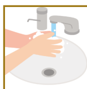
手洗い等の 手指衛生