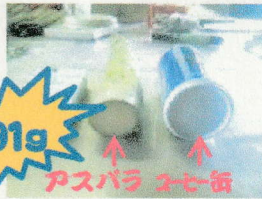
アスパラ コーヒー缶