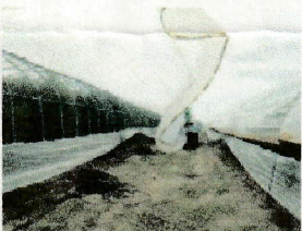
風が舞う中ビニル下ろし

おかげでハウス倒壊の危機は免れましたが、次の日、家族全員体がガタガタでした...(涙)