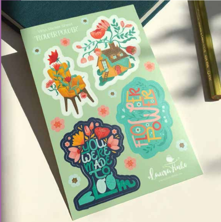
ILLUSTRATION / SURFACE DESIGN