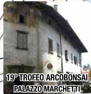
19° TROFEO ARCOBONSAI PALAZZO MARCHETTI