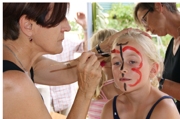
Hier entsteht ein Schmetterling