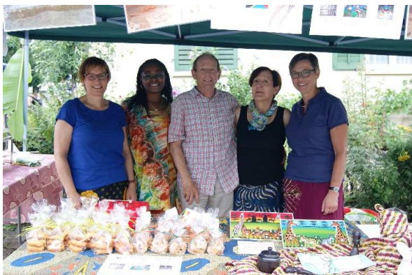
Ein Teil der fleissigen HelferInnen