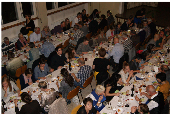
Den Gästen scheint es zu schmecken