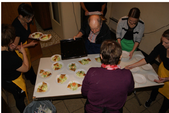
Anrichten der Vorspeise