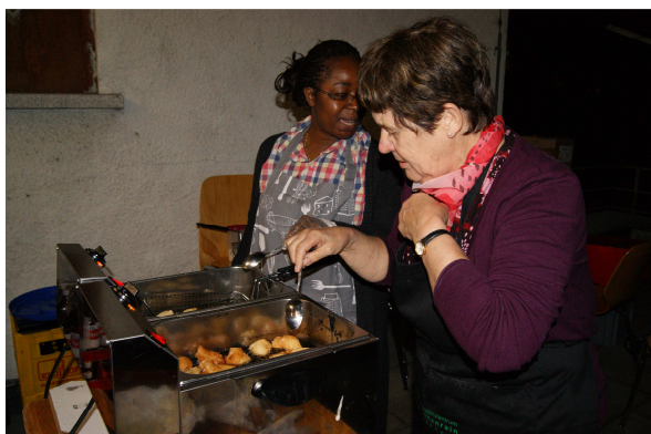
Alles wurde frisch zubereitet