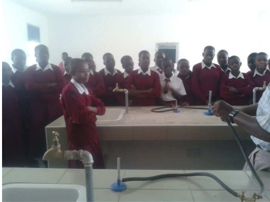
Erste Besichtigung des neuen Schullabors