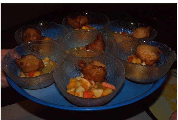
Und zum Schluss die süsse Verführung