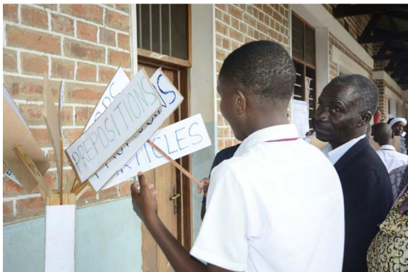
Posten zum Englischunterricht