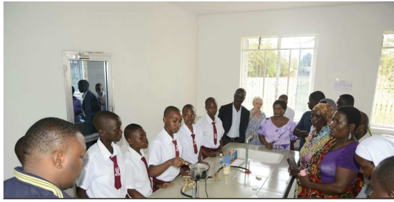
Posten zum Chemieunterricht