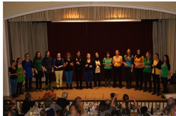
Der Vidas-Chor umrahmte das 4-Gang-Menü mit wunderbaren Gesangeinlagen