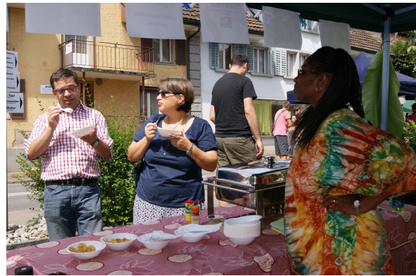
...oder für den leckeren Reis.