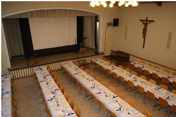
Den ganzen Nachmittag lang wurde dekoriert