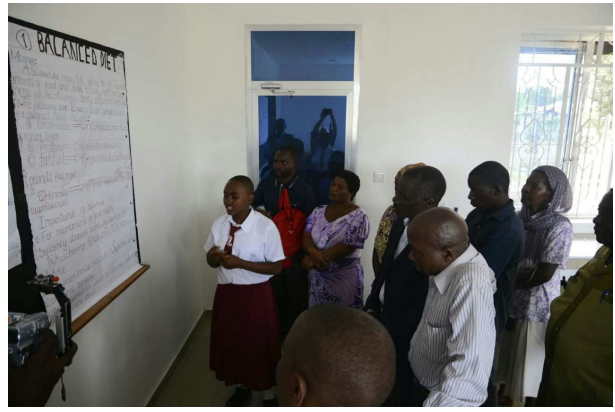
Posten zum Biologieunterricht