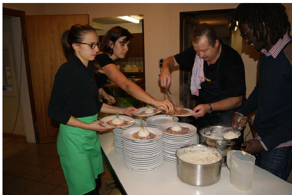
Anrichten des ersten Hauptganges