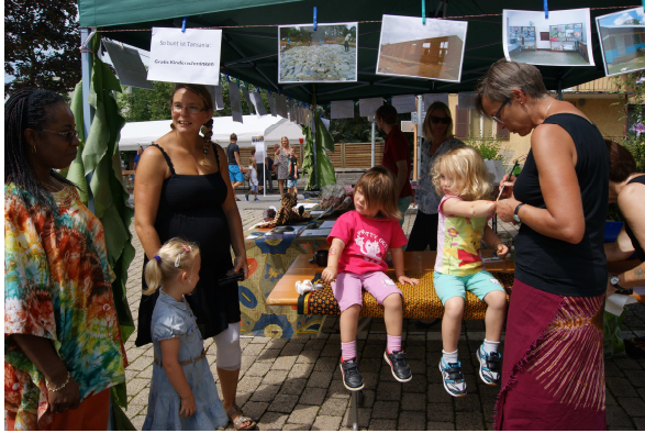
Anstehen für das Kinderschminken...