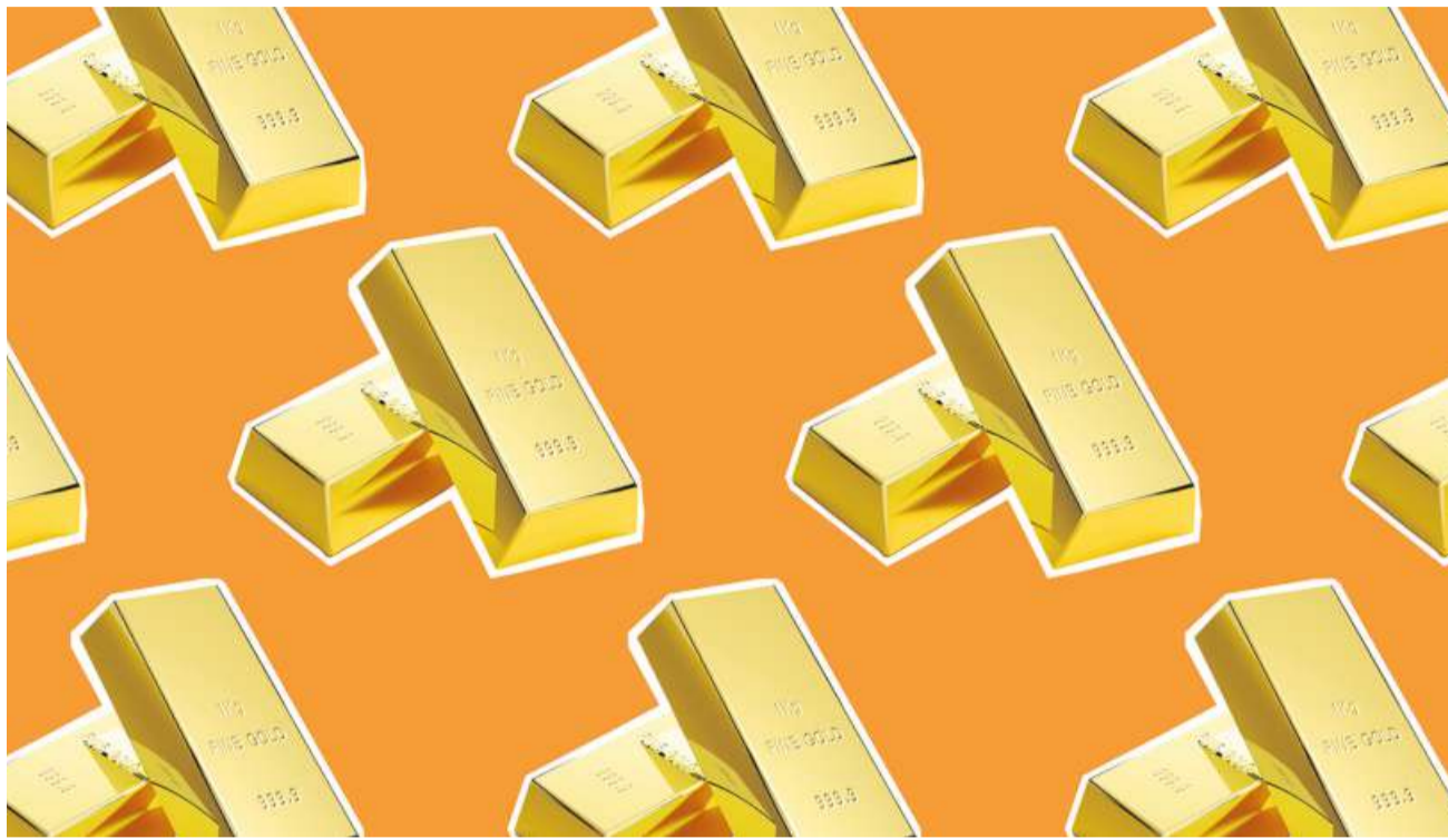
Goldbarren beweisen Beständigkeit in turbulenten Zeiten.

Hinzu kommen die Unsicherheiten über die weitere Entwicklung der amerikanischen Wirtschaft und des Haushalts unter dem künftigen Präsidenten Donald Trump. Allein seine angekündigten Steuersenkungen zur Ankurbelung