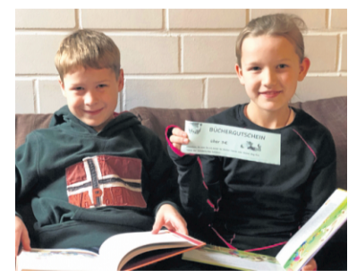
Die Kinder freuen sich über ihre Gutscheine, mit denen der Förderverein auch Freude verschenken will.

Vorlesen verbindet – sich zurücklehnen, zuhören und in die Geschichte eintauchen. Das ist wunderbare Unterhaltung und gleichzeitig eine einfache Art, neue Dinge zu erfahren und zu lernen. Selber lesen ist darüber hinaus eine Fähigkeit, die für das spätere Leben entscheidend sein kann. Texte lesen und verstehen zu können ist eine zentrale Kompetenz, denn Lesekompetenz versetzt Kinder in die