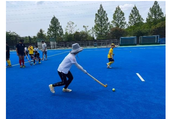
【過去の体験会の様子】