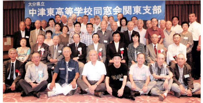
第6回関東支部総会 平成28年9月11日 アルカディア市ヶ谷

しかし、当支部の最大の課題は会員の高齢化と減少が進み、若い会員の参加もなく、非常に厳しい状況です。そして、役員・幹事の交替と運営費の確保に頭を痛めています。終わりになりますが、福岡支部の益々のご発展と会員皆様のご健勝とご多幸を祈念し、当支部のご報告といたします。