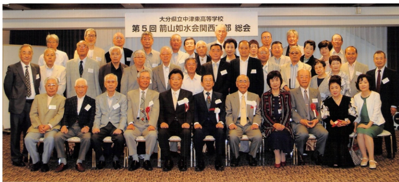
平成28年度 第5回箭山如水会関西支部総会 2016.5.29

今後支部会員の高齢化が進みますので本会の維持継続を図る為にも若い世代を迎えていくことが必須条件であり、本件が今後の支部運営に大きな課題となりますがその対策としての特効薬がございませんだけに幹事一同大変苦慮している次第です。最後に福岡支部の益々のご発展と皆様のご健勝ご活躍をお祈りしております。