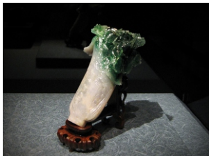
(故宮博物院の至宝 翠玉白菜)

翌日は故宮博物館へ午前中時間をかけてゆっくり見学出来ました。午後から台湾料理「欣葉」へ予約していたのでどうにか席はありましたがかなりの人でした。そこで食べた渡りガニの料理は格別でした。昼食が豪華