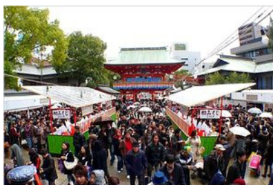
太宰府天満宮の初詣

初詣が新聞の記事になったのは明治26年の川崎大師。明治5年に品川～横浜間の鉄道開通がきっかけとなり、川崎までの交通の便が格段に良くなったことが影響したとか。人出第2位の成田山新勝寺も、京成成田駅から新勝寺