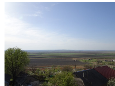
Sicht nach Rumänien

Im Frühling, am 5. April, werden wir zu einem Frühlingseinsatz aufbrechen und im Oktober (Start voraussichtlich 27. September) werden wir wieder für 10 Tage nach Moldawien reisen. Wenn du auch mal dabei sein willst, melde dich. Für den Frühlingseinsatz allerspätstens Ende Februar, für den Herbstseinsatz Ende August. Wer mit dem Auto mitkommen will, der muss mit 400 Euro für die Reise rechnen, wer lieber fliegt, der muss selber für den Flug aufkommen und für Essen und Schlafen ungefähr 100 Euro bereithalten.