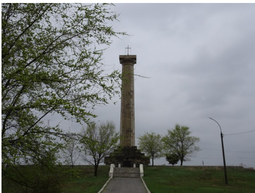
Russisches Monument in Cahul