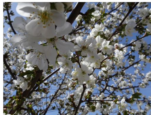
Frühling in Cahul

Immer Anfangs Januar erhalte ich einen Stoss Briefe, die ich versenden darf. Es sind die Spendenbescheinigungen für die Moldova-bridge. Da wir steuerabzugsberechtigt sind, versende ich die Briefe gerne Anfangs Jahr, so dass alle sich dann hinter die Steuererklärung klemmen können. Dies ist eine meiner Lieblingsarbeiten. Ich bin immer sehr beeindruckt und berührt, dass wir so viele treue Spender haben, die ihr Herz mit den Menschen in Moldawien teilen. An