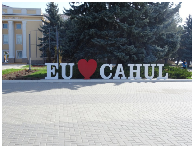
Ich liebe Cahul

Das kann einem schon zum Nachdenken bringen und ins Gebet treiben. Was würde mit unserer Arbeit passieren, wenn eine neue, machtgierige Regierung das Sagen hätte? Hattet ihr den Gedanken auch schon? Dann aber schauen ich wieder vertrauensvoll nach vorne: Martin Luther wird ein Satz nahegelegt, den er gesagt haben soll: «Und sollte morgen die Welt untergehen, ich pflanzet heute noch ein Bäumchen ein» In dieser Haltung bauen wir weiter. Wir hoffen sehr, den Bau noch im 2024 fertigstellen zu können. Danke, wenn ihr im Gebet und mit Spenden dazu beitragen könnt. (Anmerkung der Redaktion: Am 14.02. wurde das oben erwähnte Gesetz tatsächlich unterschrieben.)