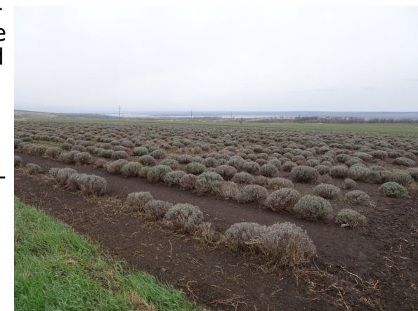
Lavendelfeld im Frühling

dieser Stelle nochmals einen herzlichen Dank, für die vielen kleineren oder grösseren Beträge, alle sind herzlich willkommen. Wenn du noch näher an der Moldawienarbeit interessiert bist, dann melde dich bei mir für unverbindliche Informationen ( sursi@sunrise.ch ). Gerne sende ich dir die Statuten und die Einladung, ein Mitglied zu werden. Dann wirst du an die jährliche GV eingeladen, über alle Details informiert und kannst deine Meinung einbringen oder auch aktiv mitarbeiten.