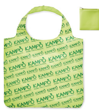
MB1010 Bolsa de compra plegable de poliéster extra grande, con asas de doble capa y funda con cremallera: 49x60cm.