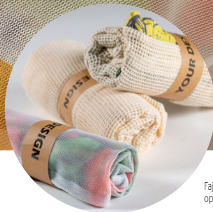
Faja de papel opcional