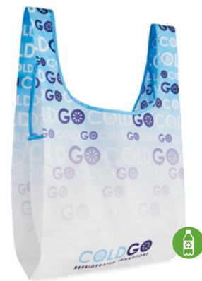
MB1111 Bolsa plegable de compra en 100% RPET con bolsillo interior. tamaño: 41x63cm.