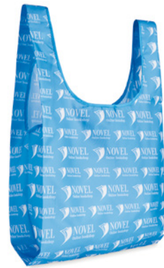
MB1011 Bolsa plegable de compra en 210D con bolsillo interior. Tamaño: 41x63cm.