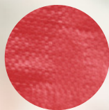
PP tejido con laminado