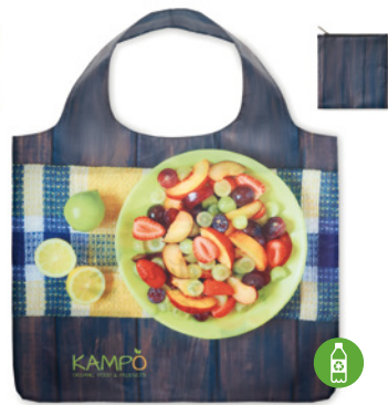
MB1110 Bolsa de compra plegable de RPET extra grande, con asas de doble capa y funda con cremallera: 49x60cm.