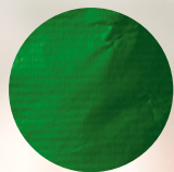
RPET con laminado