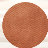
Non Woven con laminado