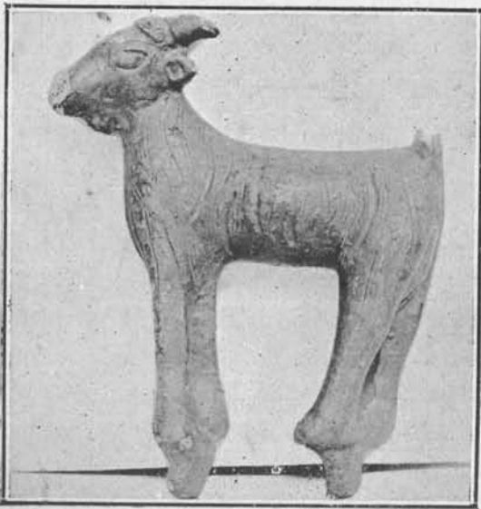
CABRA DE BRONCE

De todos los pueblos del mundo oriental el que con más certeza podemos considerar como importador de este tesoro, o de su fabricación en la Península, es el fenicio. Se trata, pues, de un tesoro púnico, ya que como dice Menéndez Pelayo, «es sumamente difícil separar la arqueología fenicia de su gran colonia africana, sin que a veces pueda establecerse un verdadero deslinde entre lo que peculiarmente atañe a la religión, cultura artística e instituciones de uno y otro pueblo».