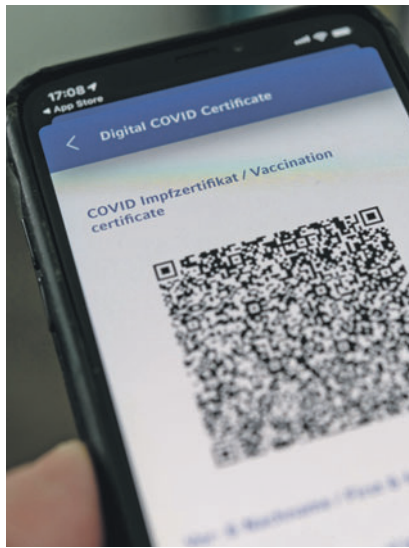
Der 3G-Nachweis wird mit dem Corona-Zertifikat erbracht.

Das Corona-Zertifikat dient als Nachweis über eine Impfung, Genesung oder einen negativen Test. Daher erhalten alle Personen das Zertifikat, wenn sie: • entweder gegen das Coronavirus geimpft sind, • oder eine Covid-19-Erkrankung überstanden haben,