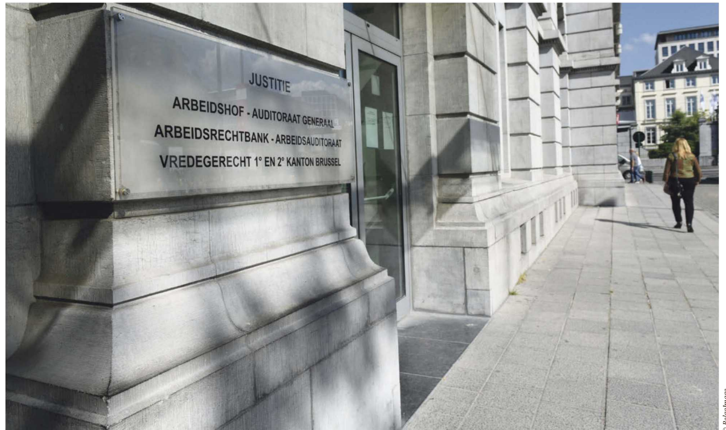
Als laatste deel van onze enquêtes polsten we bij magistraten en bemiddelaars naar mogelijke maatregelen die zij konden steunen om verzoeningen en bemiddelingen te bevorderen. Opvallend is dat beide groepen daarbij vooral voor zichzelf een taak weggelegd zien.

B emiddeling is een alternatieve conflictoplossingsmethode waarbij partijen in een dispuut op vrijwillige basis en onder deskundige begeleiding van een professionele bemiddelaar zelf een oplossing zoeken voor hun geschil (cf. art. 1723/1 Ger. W.). Dat bemiddeling een plaats moet krijgen naast de traditionele rechtspraak is vandaag een bijna algemeen aanvaarde stelling en een duidelijke beleidsopatie van de recente ministers van Justitie. Desondanks is ook in ons land de zogenaamde 'bemiddelingsparadox' overeind gebleven: ook al staat de meerwaarde van bemiddeling buiten kijf, toch geraakt de bemiddelingspraktijk maar moeilijk van de grond. Met de wijziging van het gerechtelijk wetboek door de zogenaamde waterzooiwet van 18 juni 2018 probeerde minister Geens de alternatieve methodes van conflictoplossing verder te bevorderen, onder meer door de verschillende actoren van justitie daarin een duidelijke rol toe te bedenken. Specifiek voor de magistraten werd hun verzoenende opdracht meer in de verf gezet (artikel 730/1 Ger. W.) en werd voor hen de mo-